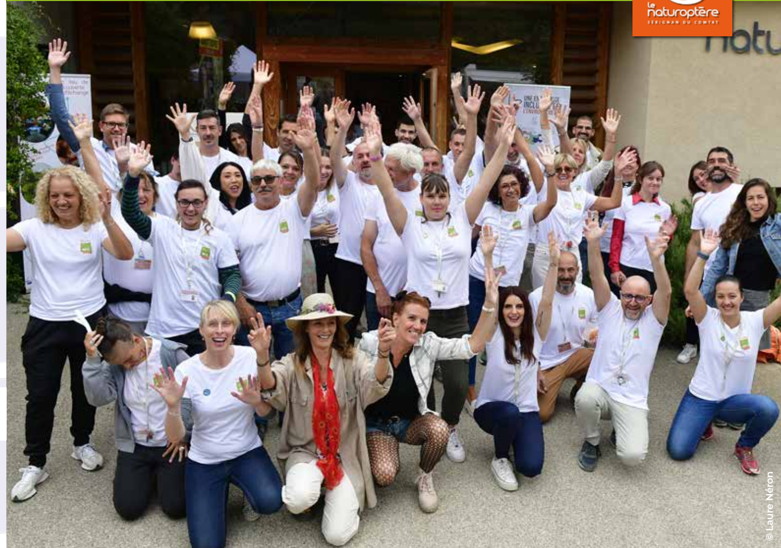
L'équipe du Naturoptère